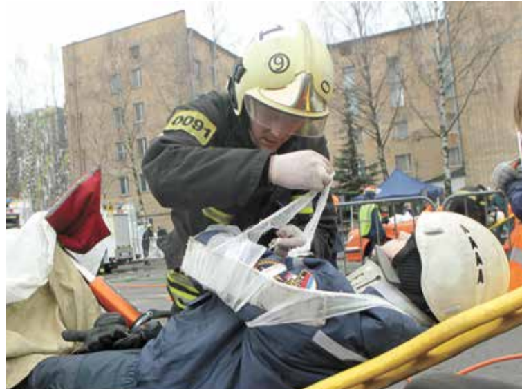
От своевременного и правильного оказания первой помощи зачастую зависит жизнь пострадавших в ДТП