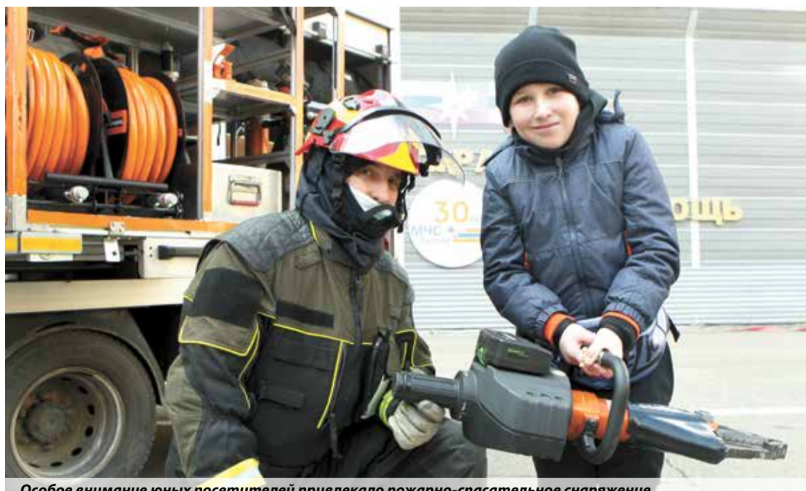
Особое внимание юных посетителей привлекало пожарно-спасательное снаряжение