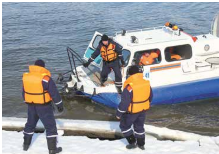
Во всех регионах страны запланированы учения РСЧС

Ситуация с природными пожарами обстоит следующим образом. В этом году первые пожары были зафиксированы уже в январе: горели заповедники в Краснодарском и Приморском краях. Сложная обстановка с природными пожарами, по данным МЧС России, ожидается на территории субъектов Сибирского, Дальневосточного, Северо-Западного, Южного и Северо-Кавказского федеральных округов. На 31 марта природные пожары действовали на территории 11 субъектов, всего же с начала пожароопасного сезона возникли 74 очага.