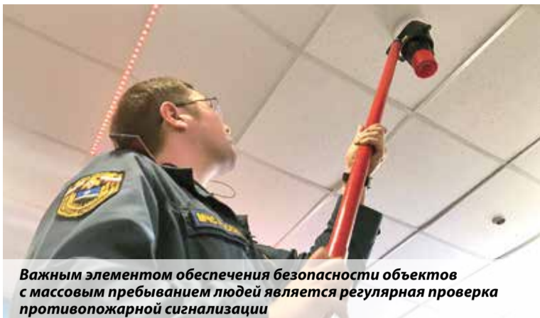
Важным элементом обеспечения безопасности объектов с массовым пребыванием людей является регулярная проверка противопожарной сигнализации

пожарной безопасности, соответствие требованиям пожарной безопасности электроустановок, электрооборудования, эвакуационных путей и выходов. Ведь эти факторы напрямую связаны с исключением возможности возникновения пожара, его обнаружением в начальной стадии, ограничением распространения, созданием условий для обеспечения быстрой и беспрепятственной эвакуации людей в безопасную зону.