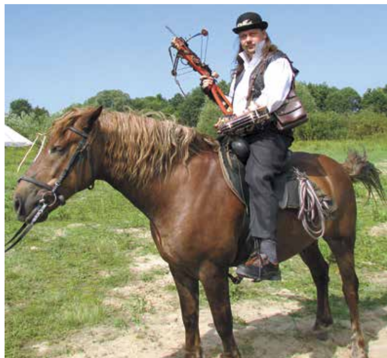
Даже в своем необычном увлечении смоленский пожарный предпочитает «быть на коне»

В свободное от работы время смоленский огнеборец занимается воссозданием альтернативной истории.