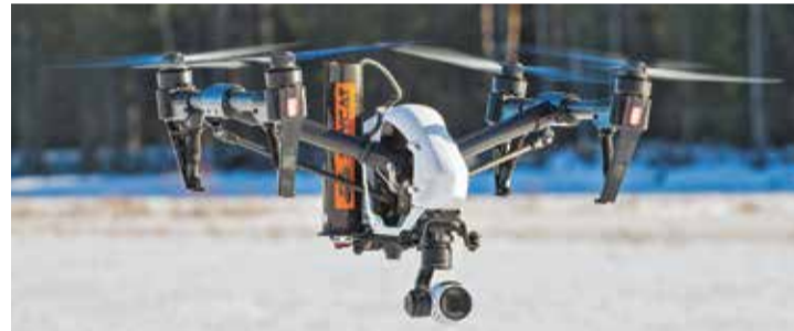
Первое место в номинации «Оперативная деятельность» получило предложение по усовершенствованию беспилотника

тия, Красноярскому краю, Ямало-Ненецкому автономному округу, Курганской области. Проявили высокую активность и ведомственные вузы — Академия гражданской защиты, Ивановская пожарно-спасательная академия ГПС, Сибирская пожарно-спасательная академия ГПС и Уральский институт ГПС.