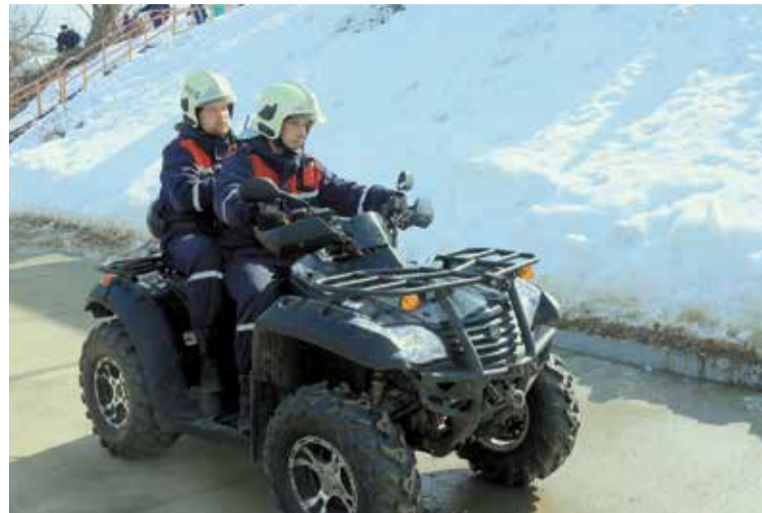
Для наблюдения за ситуацией в прибрежной зоне используется легкая вседорожная техника

Тем временем на поверхности воды спасатели обнаружили масляное пятно. На ликвидацию разлива нефтепродуктов был направлен расчет химиков поисково-