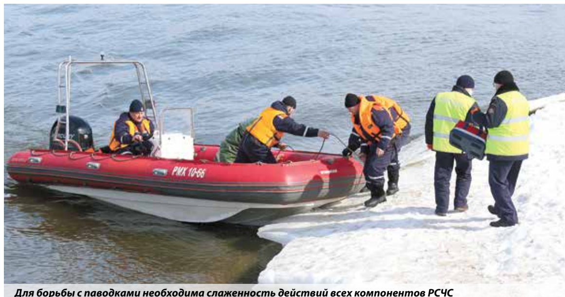
Для борьбы с паводками необходима слаженность действий всех компонентов РСЧС

По данным на первую декаду марта, высота снежного покрова на территории региона доходила до 66 см при среднемноголетних значениях до 35 см. Запас воды в снежном покрове в бассейнах московских водохранилищ составил 110–130% нормы, увлажнение почвы — на 20–40% больше нормы, глубина промерзания — от 1 до 20 см. Разрушение ледяного покрова на реках области начнется в конце марта — первой декаде апреля, в сроки, близкие к среднемноголетним. Наивысшие уровни весеннего половодья на Оке ожидаются близкими к норме, а на ее притоках — около нормы. Наполнение водохранилищ составляет до 65% от полезного объема. Исходя из предварительного прогноза весеннее половодье на территории региона ожидается в пределах и выше нормы.