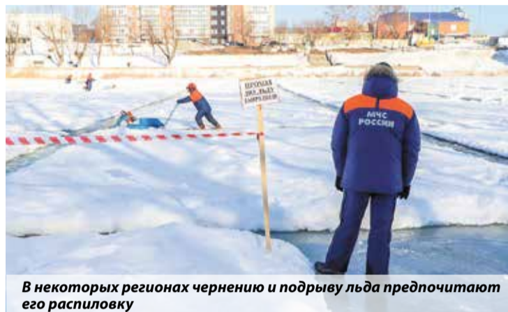
В некоторых регионах чернению и подрыву льда предпочитают его распиловку

Для безаварийного пропуска паводка проводятся чернение и распиловка льда, взрывные работы на затороопасных участках. В период весеннего половодья для оперативного мониторинга обстановки на реках запланирована работа 52 гидропо-