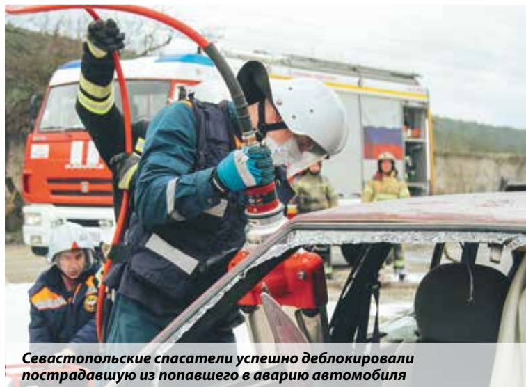
Севастопольские спасатели успешно деблокировали пострадавшую из попавшего в аварию автомобиля

ями Карламан и Приуралье на нерегулируемом железнодорожном переезде произошло ДТП с участием электрички и легкового автомобиля. В результате погибли два человека, еще один серьезно пострадал. Прибывшие сотрудники МЧС деблокировали погибших и не допустили разлива топлива.