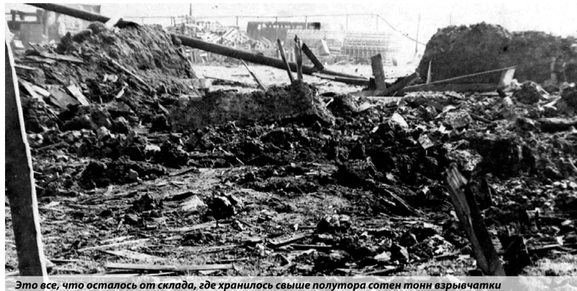
Это все, что осталось от склада, где хранилось свыше полутора сотен тонн взрывчатки

Особое уважение вызывают самоотверженные действия пожарных, которые ценой собственной жизни сумели не допустить более грандиозного взрыва, предотвратив детонацию еще трех тысяч тонн взрывчатки на других складах.