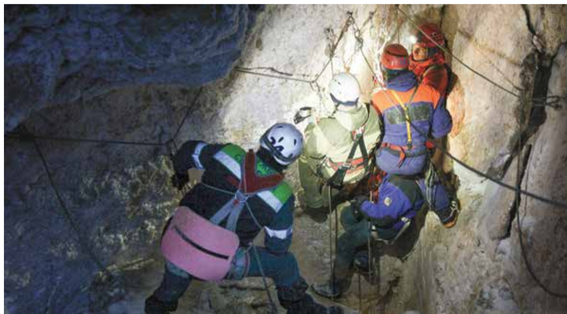
Подземелье — особый мир со своими собственными правилами выживания в нем

— Человек — как лампочка, вырабатывает 100 Вт тепла в час. 10 человек — киловатт. Прибавьте к этому тепло, которое дает горелка. Поэтому присутствие человека влияет на микроклимат пещеры, —