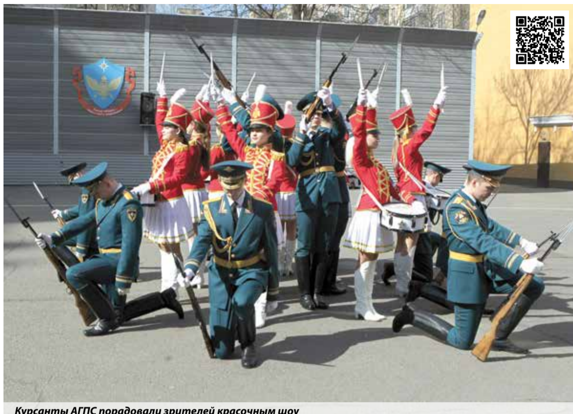
Курсанты АГПС порадовали зрителей красочным шоу

Мы из Ленинградской области. Пришли со своей крестницей, которая хочет поступить на специальность «Правовое обеспечение национальной безопасности». Нам все понравилось. На наши вопросы мы получили исчерпывающие ответы. Кроме того, мы смогли поговорить со студенткой института безопасности жизнедеятельности, которая нам рассказала про учебный процесс.