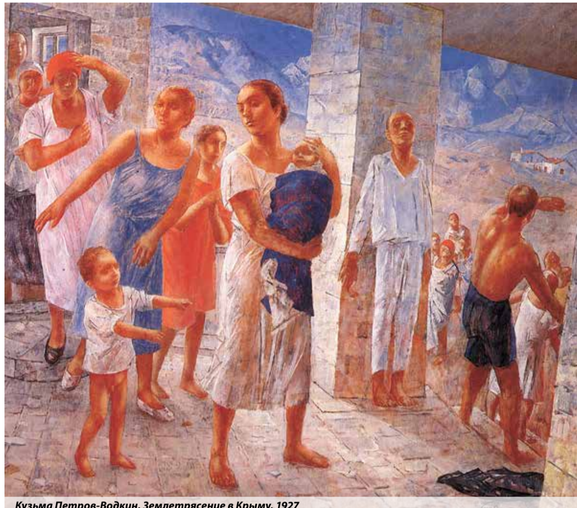
Кузьма Петров-Водкин. Землетрясение в Крыму. 1927