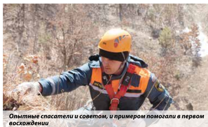
Опытные спасатели и советом, и примером помогли в первом восхождении

Алена Балабаш, пресс-служба ГУ МЧС России по Амурской области