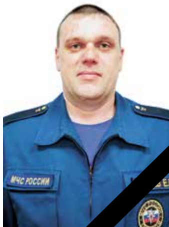
ЗЕМЦЕВ Евгений Викторович

«Это общая беда и боль для Кузбасса и для всей России. Еще раз выражаю глубокие соболезнования, слова поддержки семьям, родным и близким погибших. Желаю скорейшего выздоровления всем пострадавшим.»