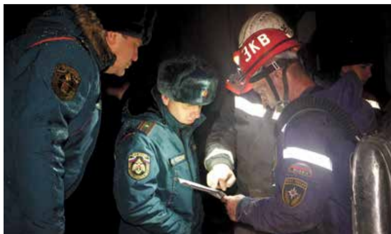
Спасательные работы на шахте начались практически сразу после взрыва

Одновременно разведка выработок проводилась силами 32 отделений ВГСЧ, обследовалось 34 км выработок. В ходе разведки обнаружено трое горнорабочих с признаками жизни. Они эвакуированы на поверхность и переданы медикам. 11 пострадавших обнаружены без признаков жизни, тела троих удалось поднять.