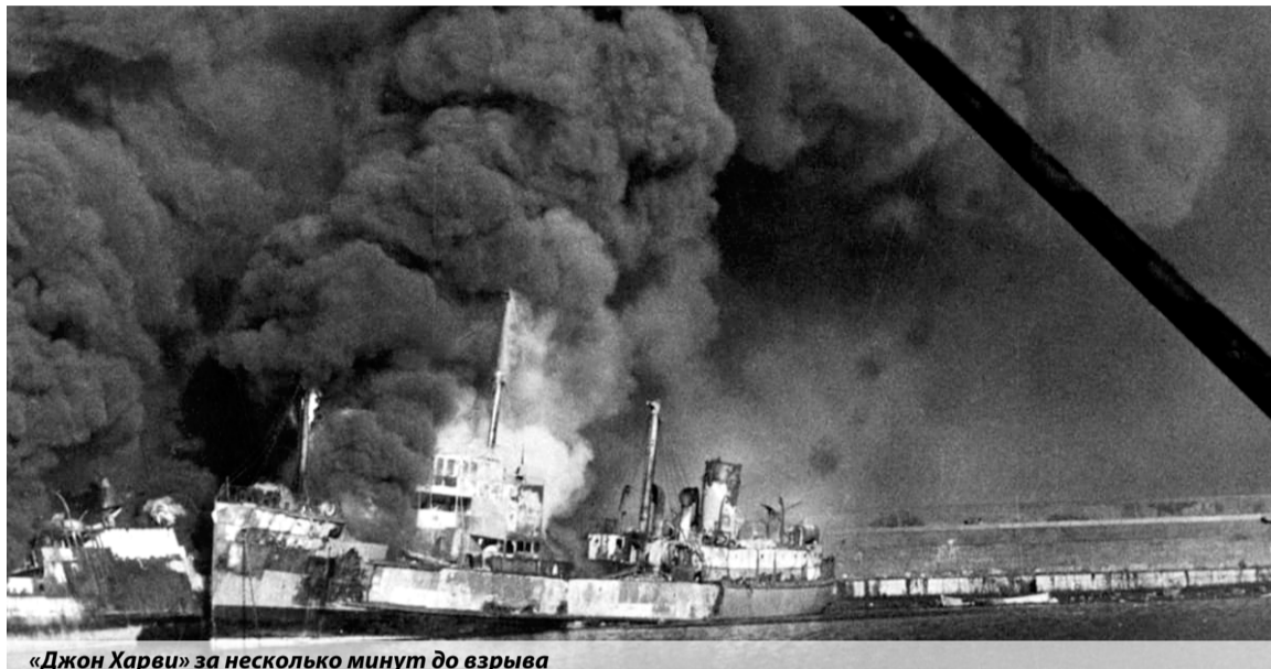
«Джон Харви» за несколько минут до взрыва

Годом ранее, получив от Сталина информацию о подготовке немцами химической войны против Красной армии, Черчилль выступил с публичным предупреждением к Гитлеру, пригрозив ударом боевыми отравляющими веществами (БОВ) по германским городам. Тогда эта угроза сработала, но после высадки в Италии американский президент Рузвельт решил подстраховаться и подготовить средства для возможного ответного удара. Согласно договору о запрещении химического оружия страна, против которой было применено химическое оружие, автоматически получала право на аналогичное и