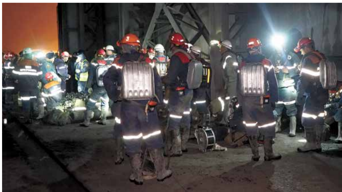
Всего к спасательным работам было привлечено почти триста человек

В связи с ухудшением обстановки в горной выработке на аварийном участке и возможностью возникновения повторных газодинамических явлений в 12.10 ведение аварийно-спасательных работ было приостановлено. Отделению ВГСЧ была дана команда выходить на поверхность.